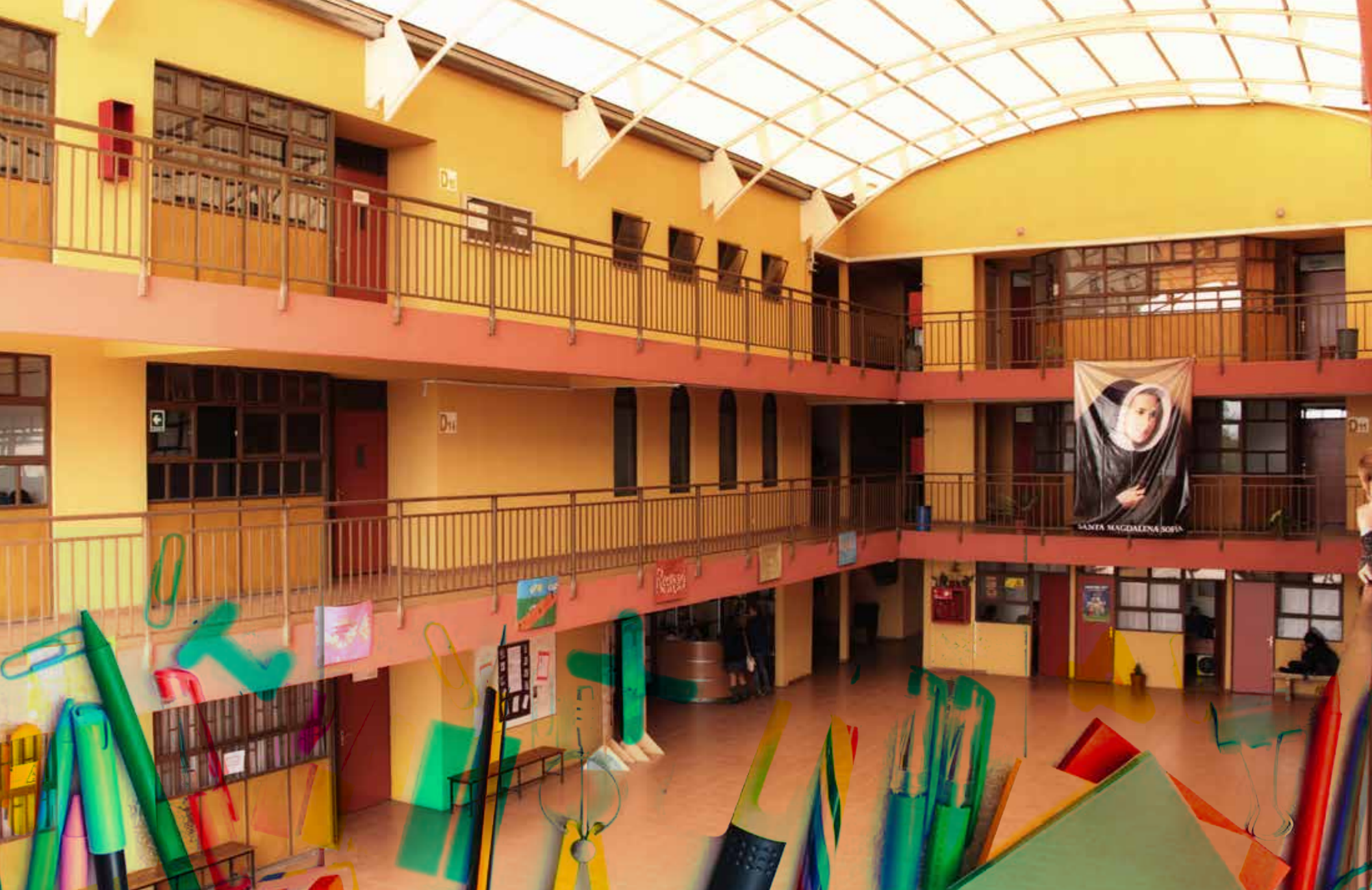
Colegio Sagrado Corazón de Lo Espejo